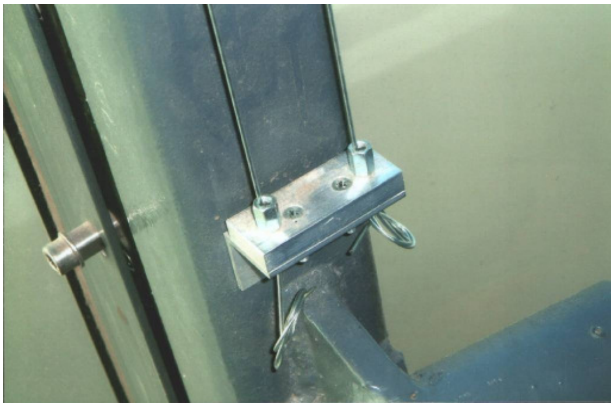
Fixations basses des câbles guide assurant la tension pour un guidage optimum