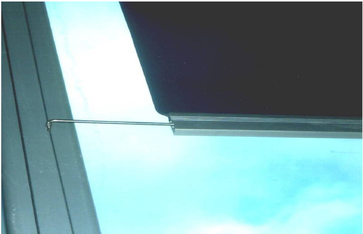
Système de guidage des barres de charge par câble acier gainé sur lesquelles couissent les guides rétractables coulissant dans les barres de charge et empêchant le film de frotter sur le vitrage.