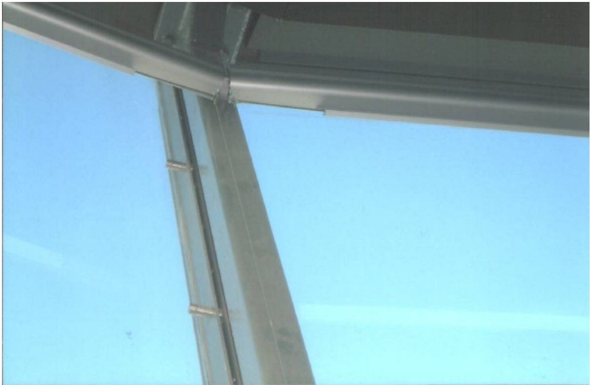
Fixation des boîtiers (stores relevés, de forme trapézoïdale)