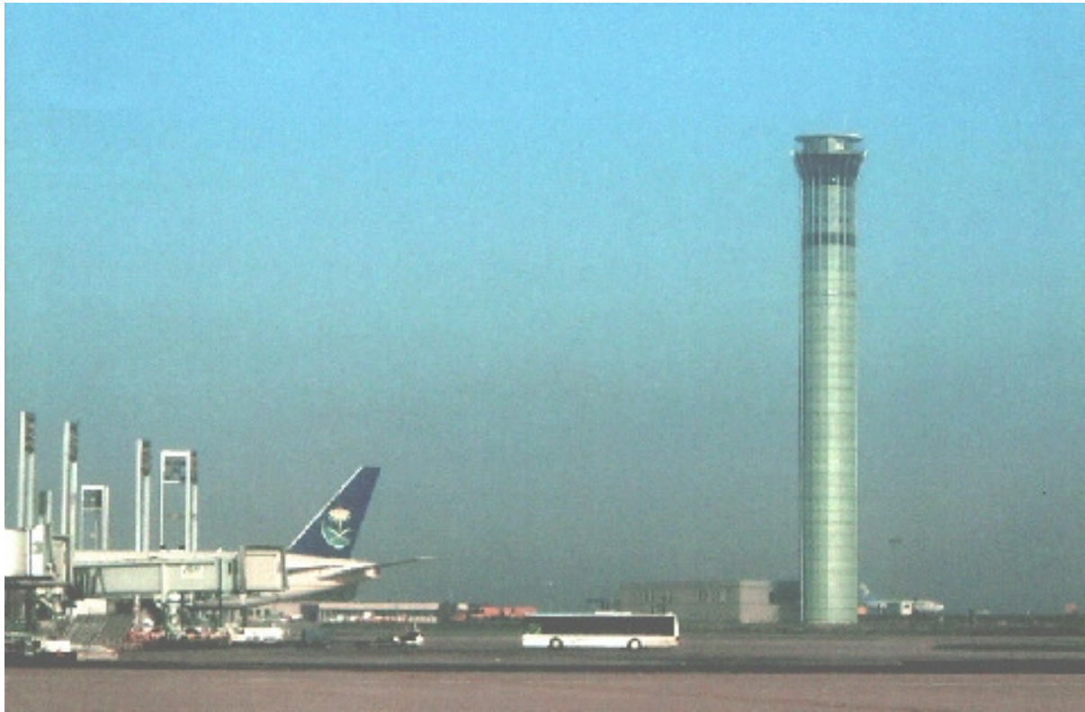
AEROPORT CHARLES DE GAULLE CDG1 TOUR DE CONTROLE NORD